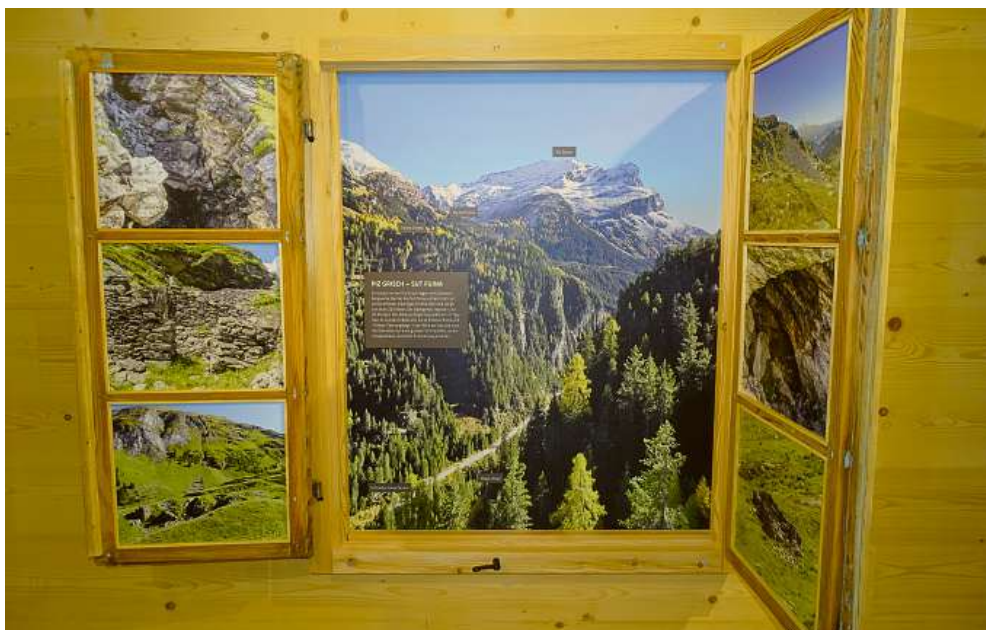
«Fenster» mit Ausblick auf die Bergwerkslandschaft.