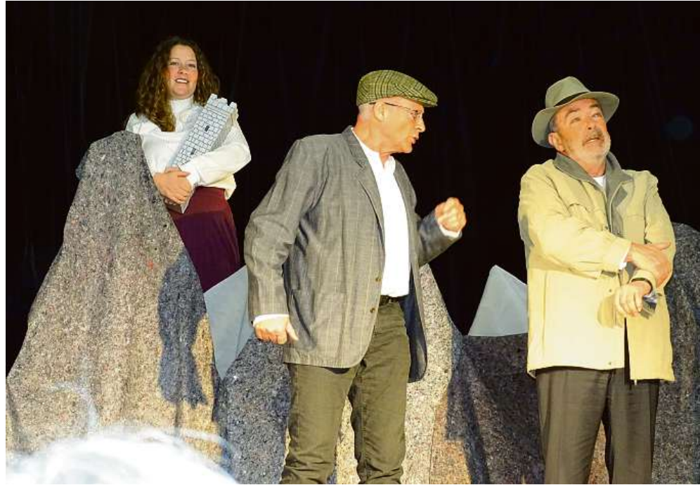
Szene aus dem Bergbautheater.

Mit einer Besichtigung des erneuerten Museums endet die Feier. Die Besucherinnen und Besucher erwartet ein Erlebnis, bei dem sie erfahren, wie die Bergbaugeschichte der Region dem Vergessen entrissen wird: zum Beispiel mit einer