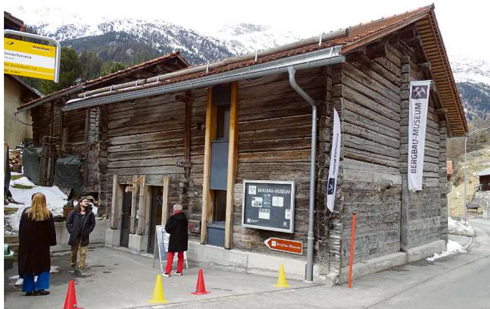
Das Bergbaumuseum Innerferrera.