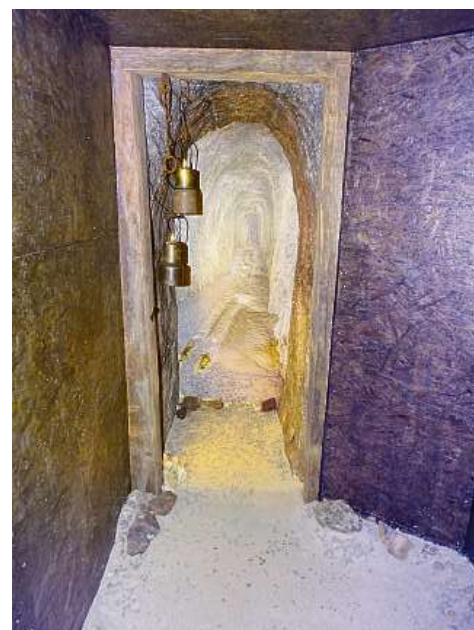
Der begehbare Stollen im Museum.

begehbaren Landkarte im Erdgeschoss, auf der alle Fundstätten der Region eingezeichnet sind. Oder mit den «Fenstern», die beim Öffnen einen fotografischen Ausblick auf bedeutende Abbaustellen eröffnen. Höhepunkt im Obergeschoss ist der begehbare nachgebaute Stolleneingang. Hier kann man erleben, in welcher Enge die Minenarbeiter